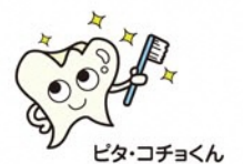
ビタ・コチョコくん