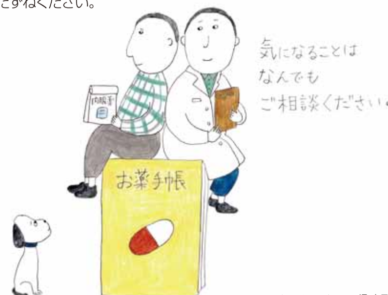
イラストレーション：堺直子

かかりつけ薬局はいわば健康に関する相談所、かかりつけ薬剤師は健康づくりのパートナー、おくすり手帳は連絡帳です。これらを上手に活用し、健康管理に役立ててはいかがでしょうか。かかりつけ薬剤師やおくすり手帳などについて、わからないことがあるときはお気軽に薬局でおたずねください。