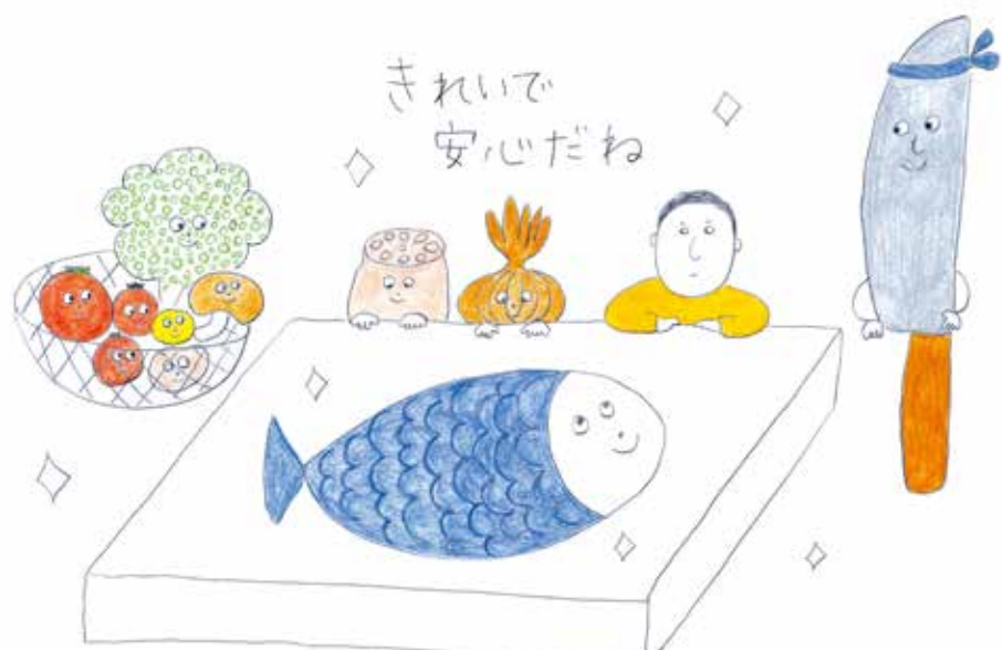
イラストレーション:堺直子

下痢や嘔吐、腹痛など食中毒が疑われる症状が現れた場合は、ただちに医療機関を受診することが大切です。なお、食中毒についてわからないことがあるときは、薬剤師に気軽にご相談ください。